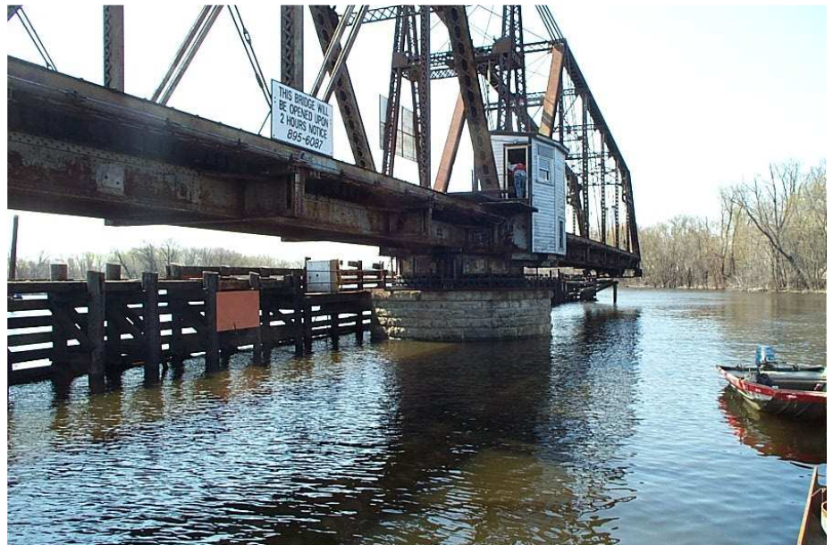
Vue du Pont La Crosse

Les données de surveillance étaient extrêmement utiles pour comprendre comment l'installation de piles affectait la structure existante, et pour permettre de définir un nouveau séquençage des travaux de telle sorte à réduire les effets sur le pont.