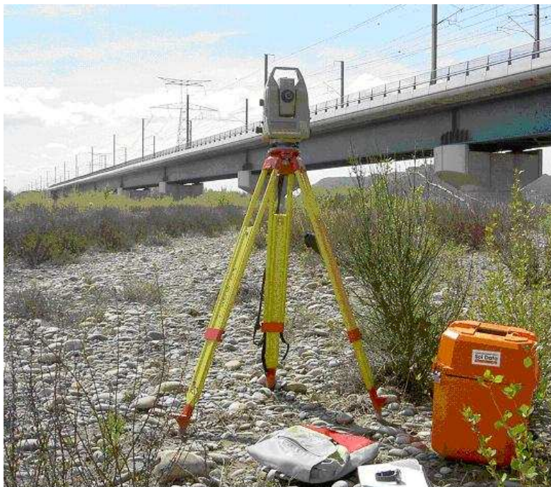
Théodolite électronique pour les mesures spatiales sur des points (prismes) placés sur l'ouvrage

Cette technologie permet d'appréhender avec une grande précision le mode de fonctionnement d'un ouvrage complexe mettant en corrélation les paramètres actifs et les évènements observés.