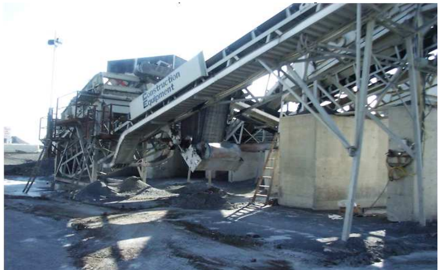
Surveillance d'une structure sensible pendant les travaux d'injection

Le système déclenchait une alarme lorsque les mouvements dépassaient les seuils limites prédéfinis. Ceci a été incorporé comme l'un des trois critères de refus pour le projet (pression, volume, et mouvement).