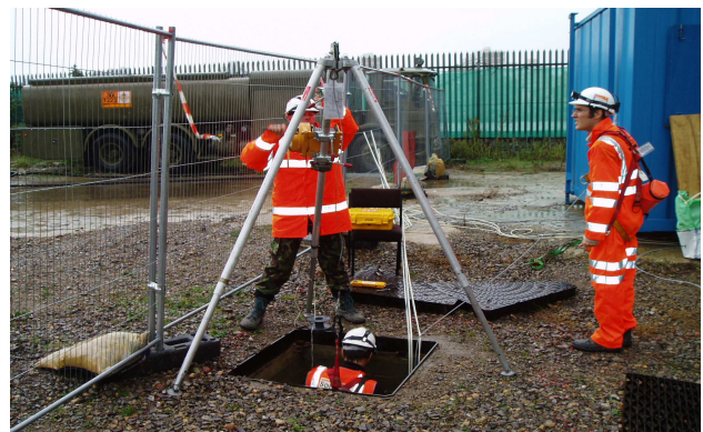
Arriba: El equipo de instalación en espacio cerrado descendiendo en el túnel con un trípode y un arnés anticaída. Abajo: vista del interior del túnel con las filas de geófonos.

La auscultación de superficie consistió en la instalación de captadores de vibraciones al nivel del suelo colocados a lo largo de las filas de tubos, en la auscultación sonora durante los periodos de funcionamiento y en lecturas manuales de los marcadores en el suelo en X, Y y Z.