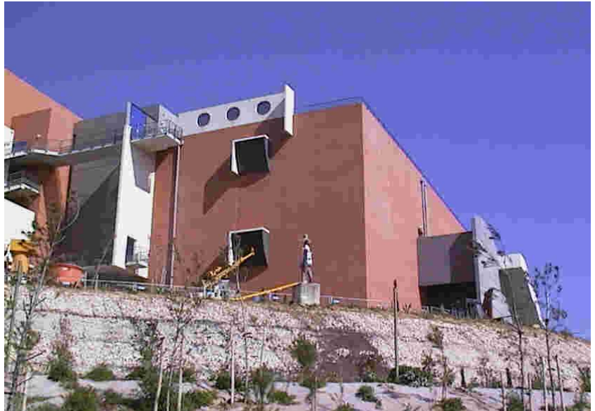
Cine UGC - Grand Littoral – Marsella

Las diferentes medidas han permitido vigilar los movimientos del edificio durante las obras de consolidación de las cimentaciones y verificar que el tratamiento realizado por la dirección de obra permitía una estabilización del cine.