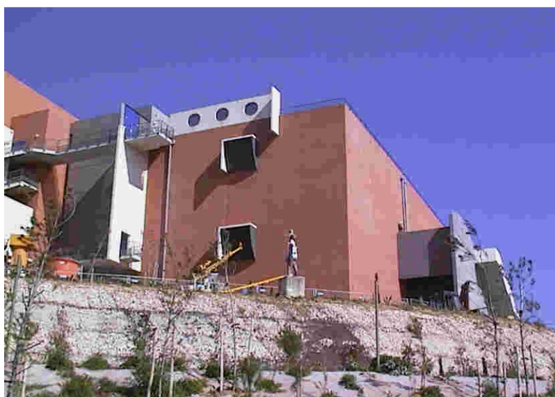
UGC Cinéma Grand Littoral – Marseille

Les différentes mesures ont permis de surveiller les mouvements du bâtiment au cours des travaux de consolidation des fondations ainsi que de vérifier que le traitement réalisé par la maîtrise d'œuvre permettait la stabilisation du cinéma.